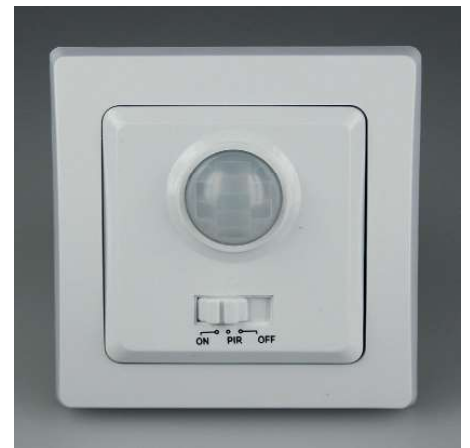
Art.-Nr. 19720: Bewegungsmelder • 230V / 400W • inkl. Rahmen • Sicherung 250V~/2A