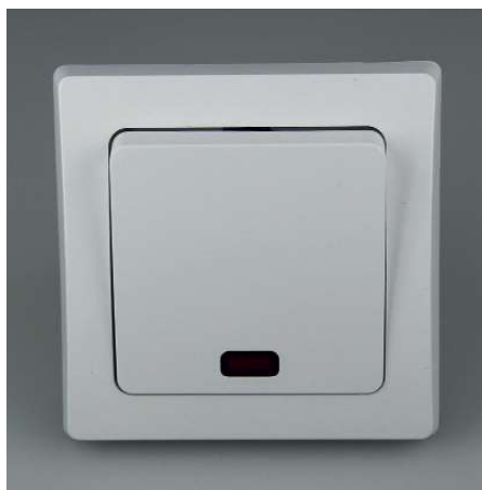
Art.-Nr. 19719: Kontroll-Schalter • 230V / 10A • inkl. Rahmen • mit Kontrollleuchte