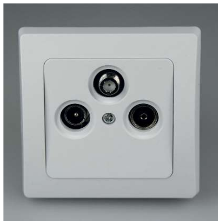
Art.-Nr. 19723: Antennendose TV+Radio+Sat • Kabel, Terrestrisch u. Sat