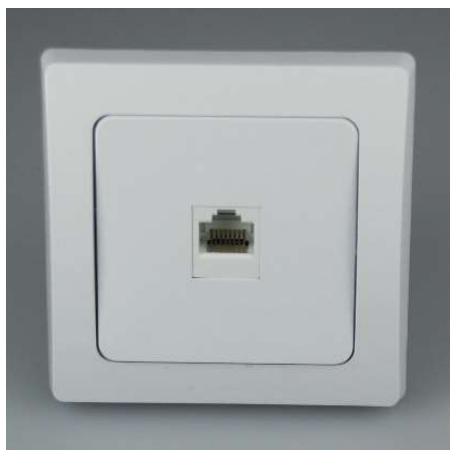
Art.-Nr. 19722: RJ45 Dose für ISDN & Cat.5 • Telefon oder Netzwerk