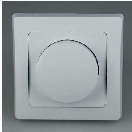
Art.-Nr. 19721: Dimmer für elektr. Trafos • 230V / 300W • inkl. Rahmen • Sicherung 250V~/2A