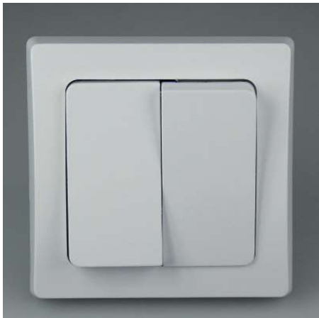
Art.-Nr. 19718: 2-fach Serien-Schalter • 230V / 10A • inkl. Rahmen