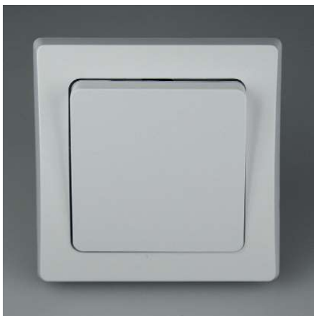
Art.-Nr. 19717: Wechsel-Schalter • 230V / 10A • inkl. Rahmen