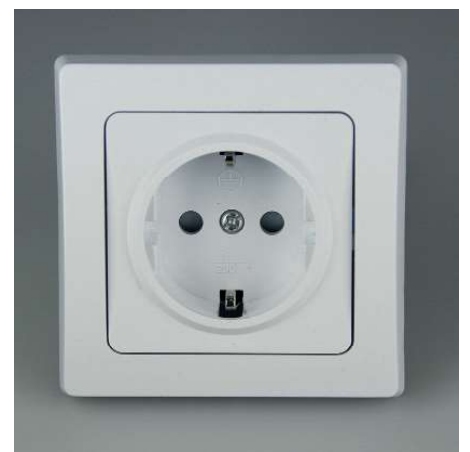
Art.-Nr. 19716: Schutzkontakt-Steckdose • 230V / 16A • inkl. Rahmen • mit Einsteckschutz