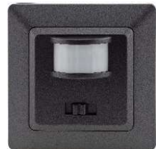
Delphi/Milos PIR Melder

Art.-Nr. 19720: DELPHI Bewegungsmelder, weiß